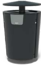
DUNC 3 STRÖMUNGEN 60L